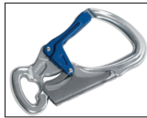
IKV 11 (EN 362:2004)