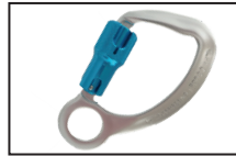
IKV 47 (ANSI Z359.12-2019)